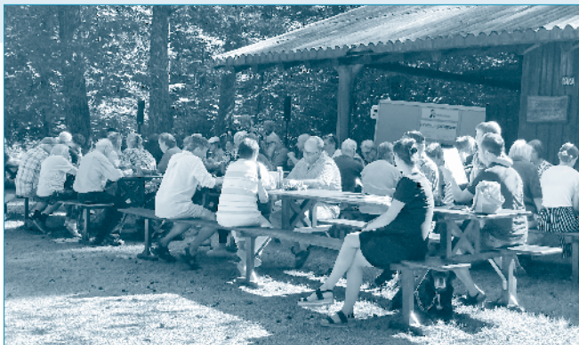
Schüliberg-Gottesdienst vom 11. August 2024.

Noch bis zum 15. September 2024 kann unter www.sozialpreis-ag.ch abgestimmt werden. Geben Sie uns Ihre Stimme - Als Zeichen der Wertschätzung für das Engagement der Freiwilligen und zur Unterstützung der begleiteten Menschen.